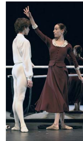
Ballet de Victor Ullate.

Nocturama. Las horas del verano. Ciclo Visiones del Patrimonio Cultural. CAAC. Monasterio de la Cartuja. 22 horas.