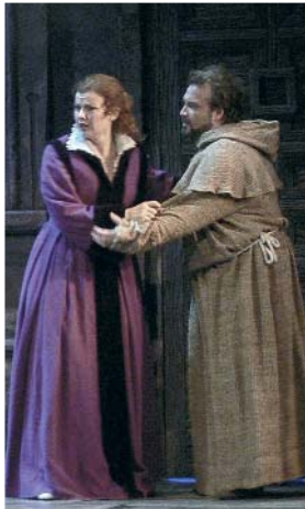
La Bruja. Teatro de la Maestranza.