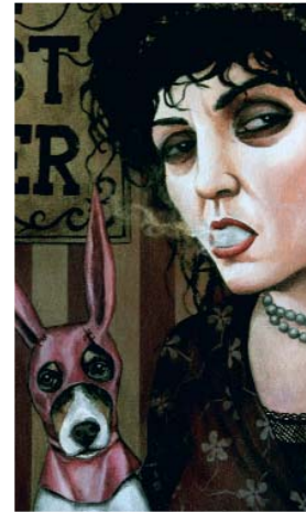
The beast timer.