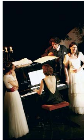
Soñando a Becquer.